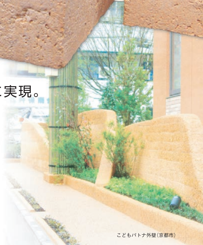
こどもパトナ外壁(京都市)

土塊レンガは、花壇等に。植栽と調和し、時間と共に独特の風合いを醸し出し、味わいのある庭づくりができます。