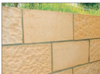
土塊ブロック縦積み