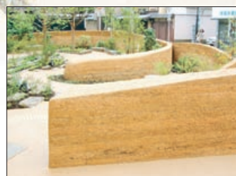
こどもパトナ内部